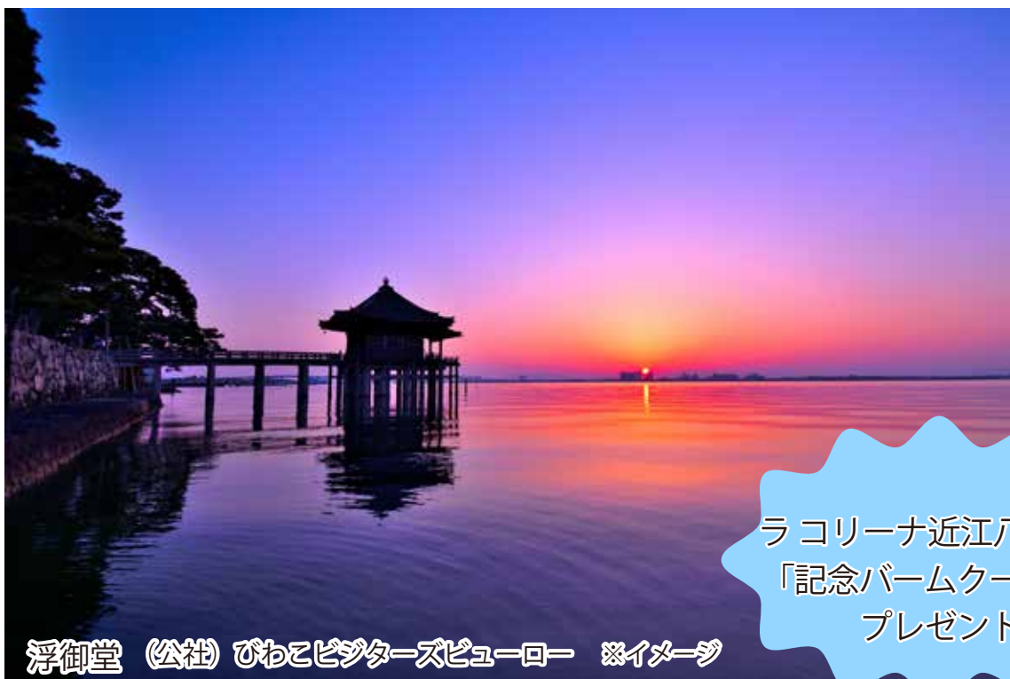
浮御堂（公社）びわこビクターズビューロー ※イメージ