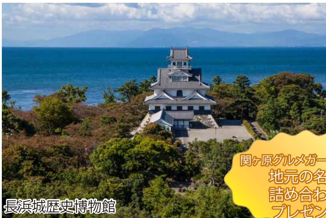
長浜城歴史博物館